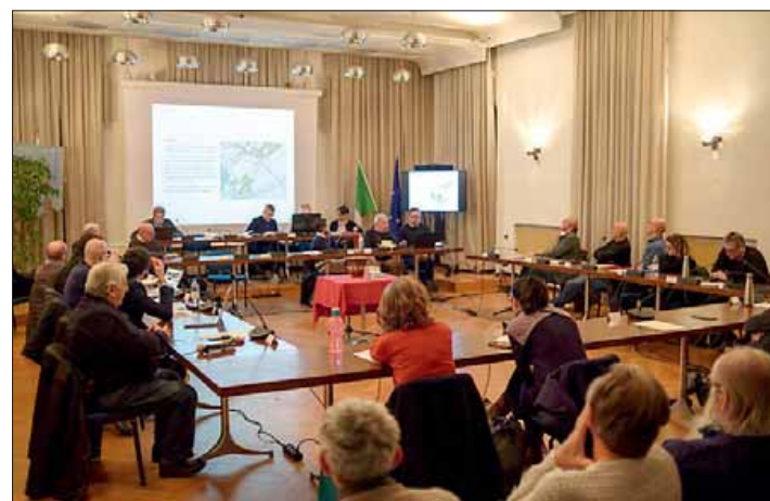
La presentazione dello studio sulla fascia lago in consiglio comunale di Arco